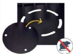
Plaque de fond anti-nuisibles fournie à installer au fond de la corbeille TERAart