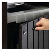
Verrouillage par serrure à clé triangulaire 8 mm