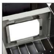
Maintien du sac par ceinture élastique