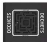
Corbeille déchets disponible avec cendrier et grille écrase mégot intégrés dans le chapeau. Capacité : 1.5L / 900 mégots