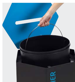
Seau intérieur en polypropylène avec anse