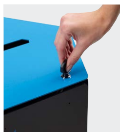
Verrouillage par serrure à clé (option)