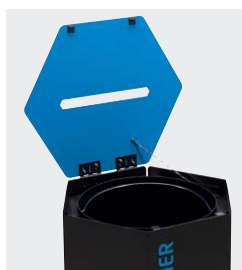
Facilité d'évacuation des déchets