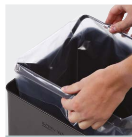
Simplicité de mise en place et retrait du sac

Les corbeilles TERAQAL sont la solution pour une collecte et un tri facile de vos déchets.