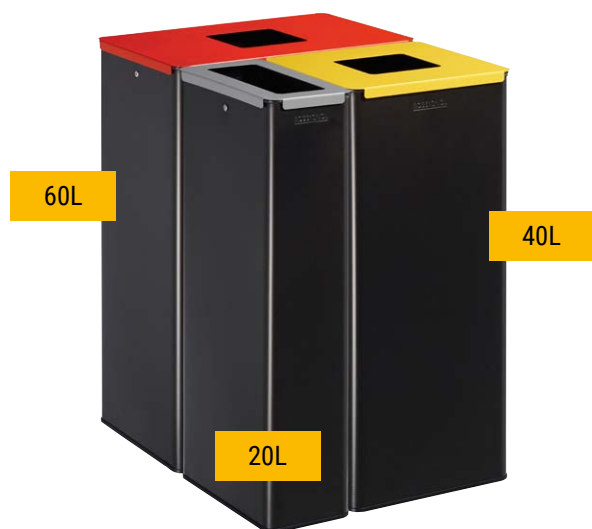
Mise en place en îlot